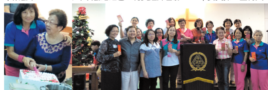
↑生日最靠近的惠章姐和爱玲姐代表切蛋糕，看她们开心笑咪咪。