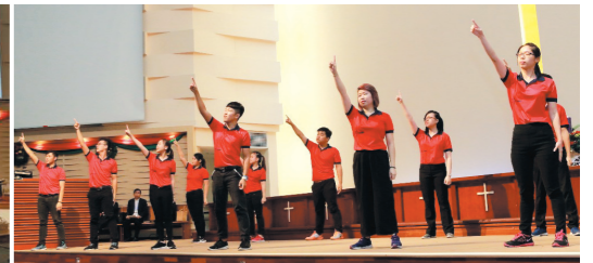
↑青团舞蹈《就是这个时刻》