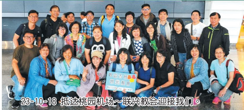
23-10-18 抵达桃园机场~联兴教会迎接我们。