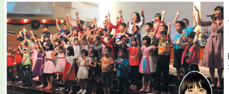
←儿童主日学唱游《保护我的是耶和華》