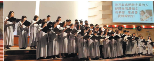
↑堂会诗班及儿少诗班献唱