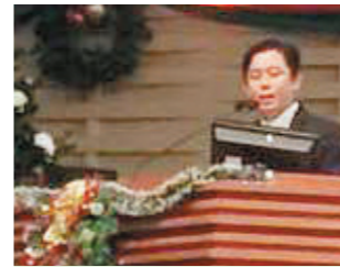
↑牧者信息《救赎解放的福音》