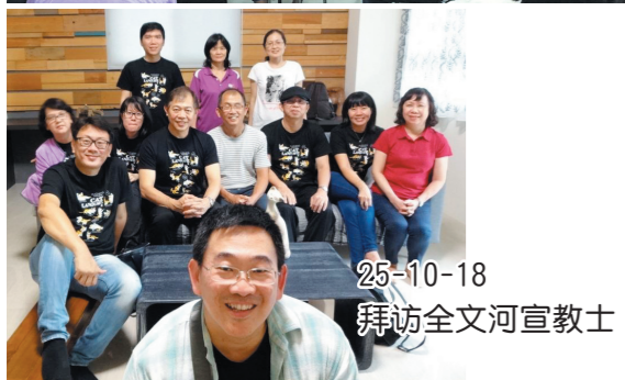
25-10-18 拜访全文河宣教士