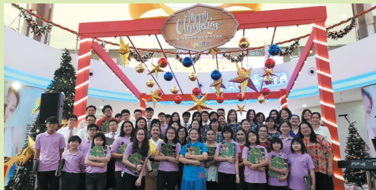
14/12/2018 @7:00pm Vivacity购物商场 堂会诗班+儿少诗班献唱，少团演剧：最好的师傅